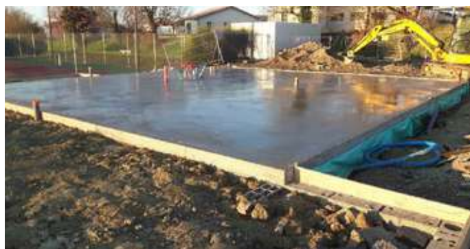
Mise en place des réservations et réalisation de la dalle – Février 2019

Le nouvel espace associatif prend peu à peu forme sur la zone de loisirs.