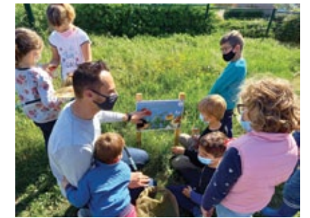
Mission découverte des insectes dans les herbes hautes

servation des abeilles et papillons à qui ces « herbes hautes » ont offert le gîte et le couvert du printemps à l'été.