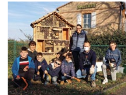
L'hôtel à insectes prêt à accueillir ses hôtes

Au cœur des espaces verts, les Petits Bidouilleurs et les CP de Mme SALA LATORRÉ ont inventorié les espèces présentes dans ces mini-prairies. Filets en main, ils ont été les témoins privilégiés de la pré-